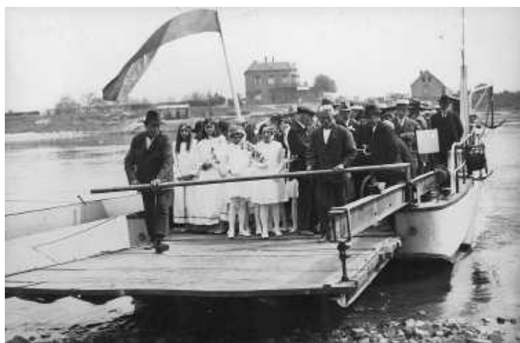
Foto: de aankomst van de Betuwse bloesemprocessie met het veer over de Nederrijn te Renkum, ca. 1935.

Ondanks secularisatie en deconfessionalisering neemt de bedevaartcultuur nog steeds een belangrijke plaats in het geloofs- en maatschappelijk leven van veel mensen in. Ook door de kerkelijke overheden worden bedevaartplaatsen nog steeds, of liever weer opnieuw, gewaardeerd als “grote steunpunten van het geloof”. Van oudsher is de katholieke kerk te Renkum onder meer een bedevaartskerk. Regelmatig komen groepen van elders om de Ma-